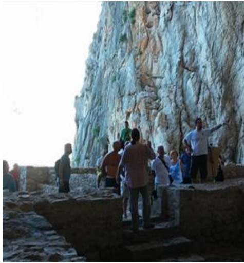
Ο Δρόμος του Άγ. Νικολάου