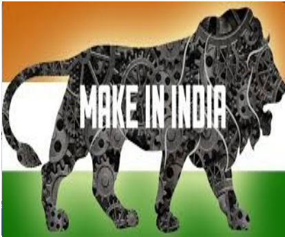
Το σύμβολο του φιλόδοξου προγράμματος “Make in India”

Σε μια προσπάθεια προώθησης του επιχειρείν στον αμυντικό τομέα, ο Ινδός Υπουργός Άμυνας εγκαινίασε την 21 η Δεκεμβρίου μια νέα ιστοσελίδα και υποσχέθηκε ότι θα επισπευστεί η αναθεώρηση της διαδικασίας προμηθειών, η οποία αναμένεται να ολοκληρωθεί τον Ιανουάριο 2016. Πρόκειται για την ιστοσελίδα www.makeinindiadefence.com και ελπίδα του Υπουργού, κ. Manohar Parrikar, είναι ότι θα