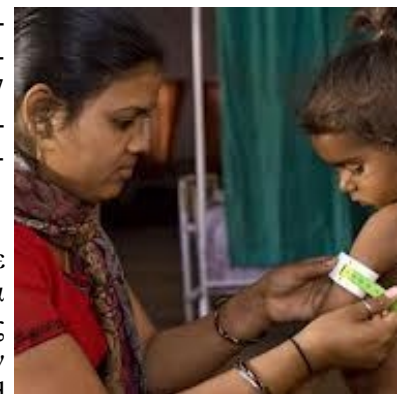
Μεγάλος αριθμός μη κανονικά ανεπτυγμένων παιδιών

2.ΚΛΙΜΑΤΙΚΗ ΑΛΛΑΓΗ: Το έτος 2015, 9 από τα 29 κρατίδια της Ινδίας αντιμετώπισαν συνθήκες ξηρασίας και ζήτησαν οικονομική βοήθεια ύψους 200 δις ρουπιών (€2,8 δις) από την κεντρική κυβέρνηση. Από την άλλη πλευρά, ενισχύθηκαν τα φαινόμενα έντονων βροχοπτώσεων στην Κεντρική Ινδία, ενώ εξασθένησαν οι μέτριες έντασης βροχοπτώσεις. Συνολικά, μόνο το 2014-15 και εξαιτίας των φαινομένων που συνδέονται με την κλιματική αλλαγή, χάθηκαν 92.180 ζώα που χρησιμοποιούνται στον γεωργικό τομέα, καταστράφηκαν 725.390 σπίτια και επλήγησαν 2,7 εκ. εκτάρια καλλιεργήσιμης γης. Σύμφωνα με έρευνα του Indian Council of Agricultural Research, είναι πιθανό, έως το 2020, να μειωθεί η παραγωγή των σημαντικότερων καλλιεργειών κατά 18%.