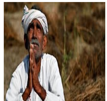
Ινδός αγρότης προσεύχεται να βρέξει

κύριους λόγους για το φαινόμενο την πτώχευση ή υπερχρέωση των αγροτών, τα προβλήματα που συνδέονται με την παραγωγή (μη απόδοση της σοδειάς, καταστροφή της παραγωγής λόγω φυσικών φαινομένων, αδυναμία πώλησης), την ακραία φτώχεια κ.ά.