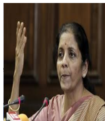
Η Υπουργός Εμπορίου & Βιομηχανίας της Ινδίας, κα Nirmala Sitharaman

Η Υπουργός Εμπορίου, κα Nirmala Sitharaman, δήλωσε στην ίδια συνεδρίαση, ότι η Ινδία είχε υποστήριξη από πολλές αναπτυσσόμενες και φτωχές χώρες, αλλά ότι λίγες ανεπτυγμένες χώρες, συμπεριλαμβανομένων των ΗΠΑ, αντίταχθηκαν στη συνέχιση του Γύρου της Ντόχα.