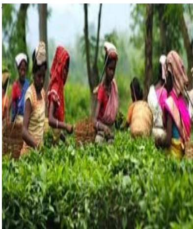
Φυτεία τσαγιού στη Νότιο Ινδία

να εφαρμόσει σειρά οικονομικών μεταρρυθμίσεων, ώστε η οικονομία της να καταστεί ανταγωνιστική, για να μπορέσει στο μέλλον να επωφεληθεί από ανάλογες συμφωνίες. Σημειώνεται, ότι η TPP φιλοδοξεί να γίνει η μεγαλύτερη ζώνη ελεύθερου εμπορίου, εκπροσωπώντας το 40% της παγκόσμιας εμπορικής δραστηριότητας.