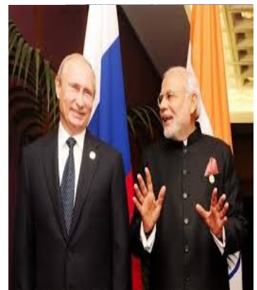
Ο Ινδός Πρωθυπουργός Narendra Modi με τον Ρώσο Πρόεδρο Vladimir Putin στην πρόσφατη επίσκεψη του πρώτου στη Μόσχα

7. Μνημόνιο Κατανόησης μεταξύ GLONASS και Centre for Development of Advance Computing για συνεργασία σε εμπορικές εφαρμογές μέσω ενσωμάτωσης ρωσικών και ινδικών συστημάτων δορυφορικής πλοήγησης.