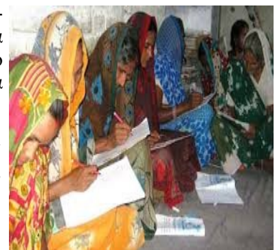
Πρόγραμμα διδασκαλίας γραφής σε αγρο-

4.ΑΝΑΦΑΛΒΗΤΙΣΜΟΣ: 282 εκ. Ινδοί είναι αναλφάβητοι, αριθμός μεγαλύτερος από τον συνολικό πληθυσμό της Ινδονησίας. Ο Προϋπολογισμός έτους 2015-16 μείωσε τόσο τις δαπάνες για την Παιδεία (-16%), όσο και αυτές για την ανάπτυξη των ανθρώπινων πόρων (-4,6%). Οι δημόσιες δαπάνες για την εκπαίδευση ανήλθαν το 2013 κατά μέσο όρο παγκοσμίως σε 4,9%, σε σύγκριση με 3,3% στην Ινδία, σύμφωνα με στοιχεία της Παγκόσμιας Τράπεζας. Σχεδόν το 18% των μαθητών δεν συμπληρώνουν τη δευτεροβάθμια εκπαίδευση, ενώ σε εξετάσεις αξιολόγησης μέσα στο έτος 2015, το 99% των δασκάλων πρωτοβάθμιας εκπαίδευσης στο κρατίδιο Maharashtra απέτυχε, παρά το γεγονός ότι δαπανήθηκε ποσό $94 δις την τελευταία δεκαετία για την εκπαίδευσή τους.