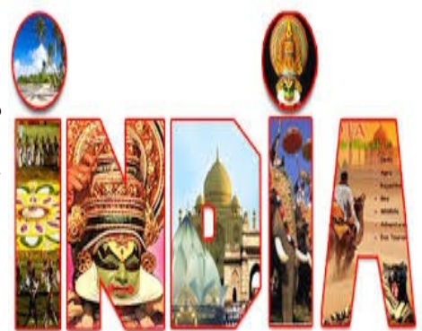
Κρατική διαφήμιση για τον ινδικό τουρισμό

τουρισμού, γεγονός που σημαίνει ότι η κρίση εντοπίζεται στο υπόλοιπο κομμάτι του τομέα. Τονίζουν, δε, ότι η Ινδία έχει μεγάλο ανταγωνισμό από τις γειτονικές σε αυτή χώρας, που επίσης αποτελούν εξωτικούς προορισμούς για Ευρωπαίους και Αμερικανούς, αλλά δεν κατάφερε να κάνει τα κατάλληλα βήματα που αυτές έχουν κάνει για την αύξηση του