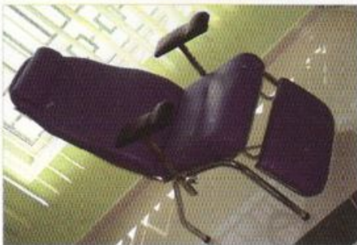
Fauteuil de repos