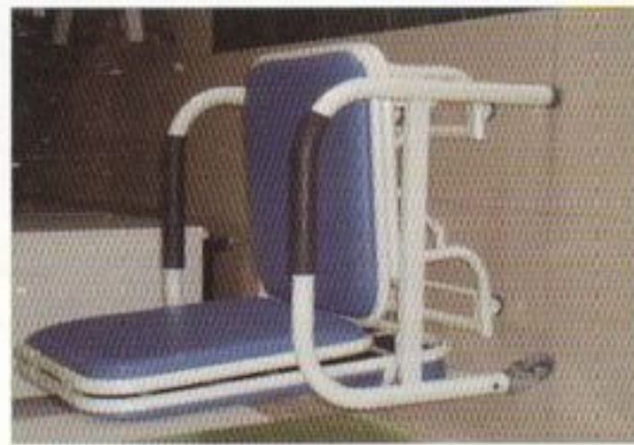
Chaise de repos transformable en lit