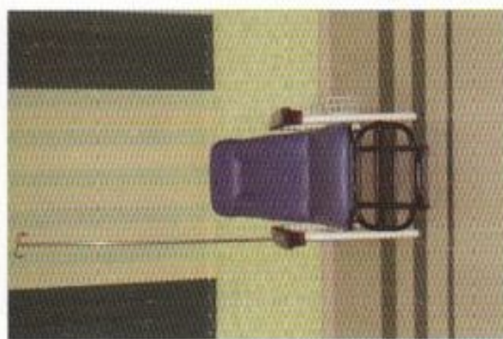
Chaise relax de prélèvements sanguins