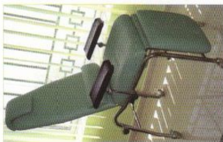
Fauteuil de prélèvement