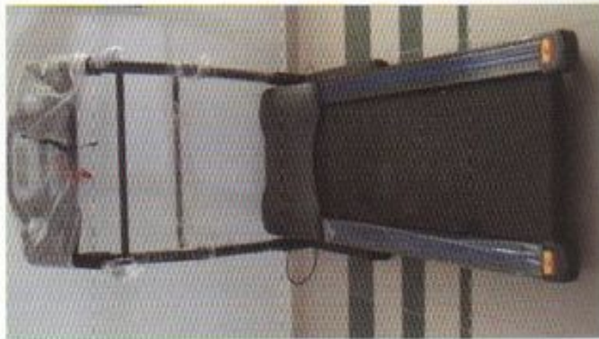
Tapis roulante M2