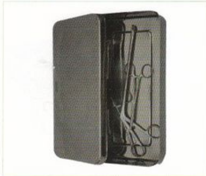
Boite de petite chirurgie