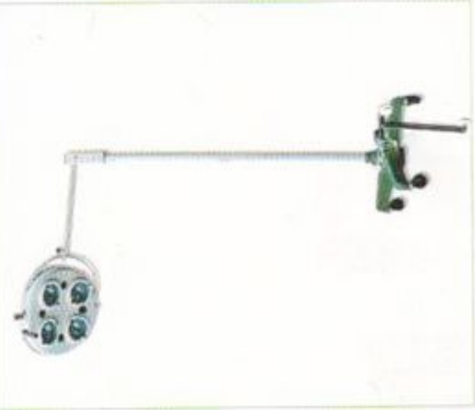
Lampe scialytique mobile