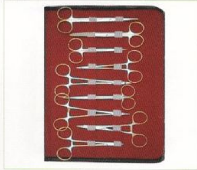
Trousse de dissection