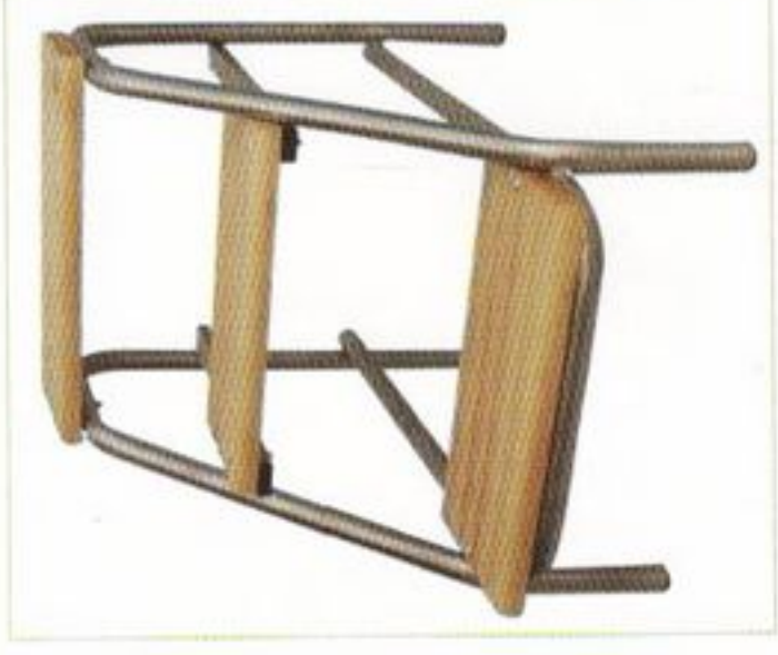
Escabeau à 3 marches