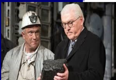
Ο Γερμανός Πρόεδρος κ. Steinmeiere

Στις 21.12.2018 σταμάτησε επίσημα, μετά από 200 χρόνια, η εξόρυξη άνθρακα στο Bottrop της BPB. Στην επίσημη τελετή παραβρέθηκαν 500 προσκεκλημένοι, ανάμεσα στους οποίους ο Πρόεδρος της Γερμανίας, στον οποίο παραδόθηκε το τελευταίο κομμάτι άνθρακα από τους εναπομείναντες 8 ανθρακωρύχους, ο Πρωθυπουργός της BPB και ο Πρόεδρος της Ευρωπαϊκής Επιτροπής. Το συγκεκριμένο