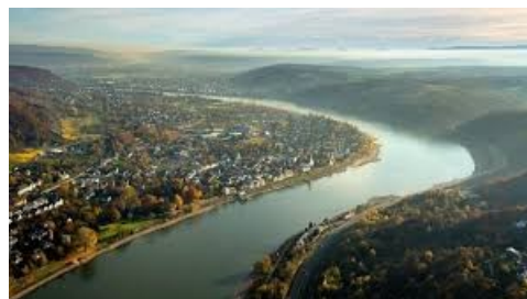
Ο ποταμός Ρήνος

μεταφοράς, που εκτοξεύτηκε εξαιτίας της χαμηλής στάθμης του νερού του Ρήνου. Άλλες εταιρείες της περιοχής, που ανακοίνωσαν παρόμοια προβλήματα ήταν η εταιρεία παραγωγής λιπασμάτων K+S, καθώς και η εταιρεία ενέργειας EnBW.