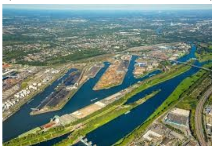
Το λιμάνι του Duisburg

Duisburg-Essen φοιτούν τη στιγμή αυτή περισσότεροι από 2.000 Κινέζοι φοιτητές, οι περισσότεροι στο Τμήμα Μηχανικών. Μέχρι τώρα οι Κινέζοι φοιτητές επέστρεφαν στη χώρα τους μετά το πέρας των σπουδών τους, κάτι που θα μπορούσε να αλλάξει με τη γενικότερη μεταβολή του αστικού τοπίου της πόλης.