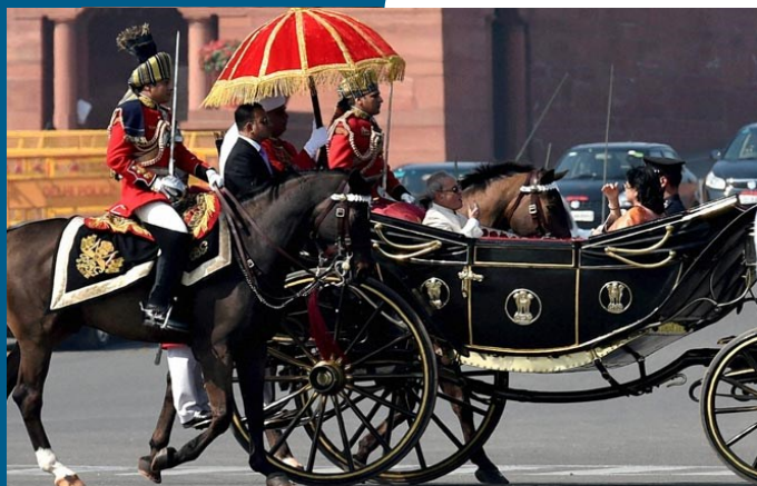
Ο Ινδός Πρόεδρος, κ. Pranab Mukherjee, φθάνοντας στο Κοινοβούλιο

« η αναπτυξιακή φιλοσοφία της Κυβέρνησης είναι καταπολέμηση της φτώχειας, η οποία συνιστά τη χειρότερη μορφή βίας».