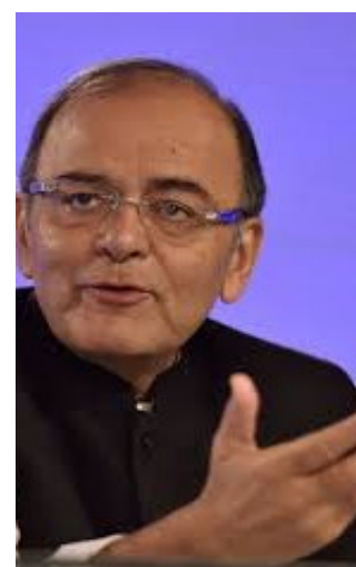
Ο Υπουργός Οικονομικών της Ινδίας, κ. Arun Jaitley

συνεχίζεται η ενίσχυση των επενδύσεων για υποδομές , κυρίως δρόμους και σιδηροδρόμους, με το ποσό των 2,2 τρις ρουπιών. Αναφορικά με τον χρηματοπιστωτικό τομέα περιλαμβάνονται αρκετές προτάσεις, με πρωταρχικό στόχο την επίλυση του προβλήματος των συσσωρευμένων επισφαλών οφειλών στις κρατικές τράπεζες και την τόνωση της πιστωτικής επέκτασης της οικονομίας , αν και η κατανομή του ποσού των 250 δις ρουπιών για την κεφαλαιοποίηση των κρατικών τραπεζών θεωρήθηκε από αναλυτές κατώτερη των προσδοκιών της αγοράς. Ο εταιρικός φόρος παραμένει σταθερός σε 30% για το επόμενο οικονομικό έτος, με εξαίρεση τις νέες εταιρείες του μεταποιητικού τομέα που θα δημιουργηθούν, για τις οποίες η φορολογία θα κυμαίνεται σε 25%, καθώς και τις μικρές εταιρείες με ετήσιο κύκλο εργασιών κάτω των 50 εκ. ρουπιών, για τις οποίες ο βασικός εταιρικός φόρος θα ανέρχεται σε 29%. Στα αρνητικά σημεία του σχεδίου Προϋπολογισμού , σύμφωνα με τις αναλύσεις που δημοσιεύτηκαν στον Ινδικό τύπο, περιλαμβάνονται οι χαμηλές δαπάνες για δημόσιες