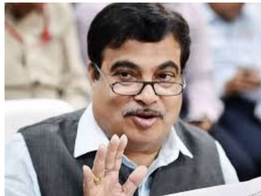
Ο Ινδός Υπουργός Ναυτιλίας, κ. Gadkari

Ινδός πρωθυπουργός, ο υπουργός ναυτιλίας, κ. Gadkari, ανακοίνωσε ότι στόχος της Κυβέρνησης είναι η δημιουργία 4 εκ. άμεσων και 5 εκ. έμμεσων θέσεων εργασίας στον συγκεκριμένο τομέα τα επόμενα πέντε χρόνια. Πρόσθεσε, ότι το υψηλό κόστος εφοδιασμού στη χώρα του έχει αρνητική επίδραση στον μεταποιητικό τομέα, ενώ εάν επιτευχθεί ανάπτυξη κοντά στους λιμένες το κόστος αυτό θα μειωθεί και οι εξαγωγές θα διπλασιαστούν.