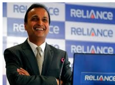
Ο CEO της Reliance, κ. Anil Ambani

μονάδα παραγωγής θα βρίσκεται στο Dhirubhai Ambani Land Systems Park, Pithampur, Indore, στο κρατίδιο Madhya Pradesh και θα απασχολεί 3.000 ειδικευμένο προσωπικό. Στο παρελθόν, η Rafael έχει προμηθεύσει την ινδική πολεμική αεροπορία με αερόστατα. Τέλος, ανακοινώθηκε ότι τα προϊόντα της κοινοπραξίας θα διατεθούν εξολοκλήρου στις ινδικές ένοπλες δυνάμεις.