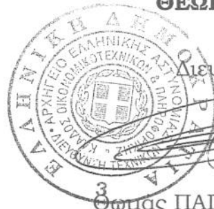
3 Θωμάς ΠΑΠΑΔΗΜΗΤΡΙΟΥ Αστυν. Δ/ντής