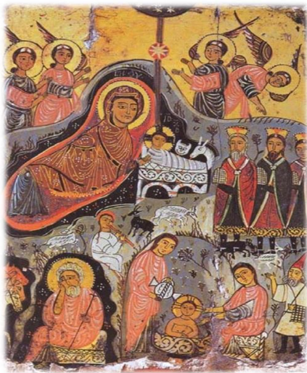
Εγκαυστική εικόνα από τη Μονή Αγίας Αικατερίνης Σινά 7ος αι. μ.Χ.