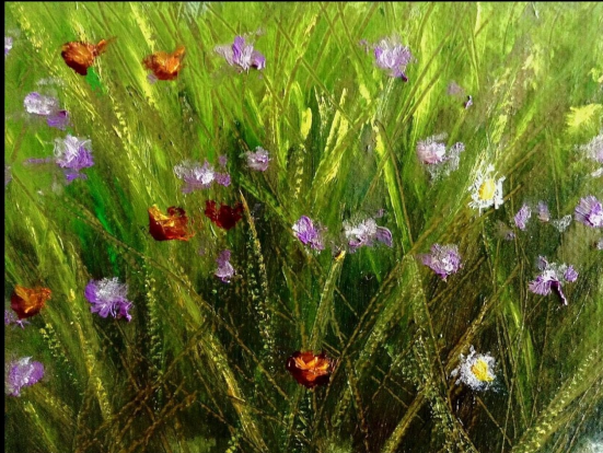
Χρήστος Γαρουφαλής "Έαρ μικρό", λάδι σε μουσαμά, 17x20 εκ. (λεπτομέρεια)