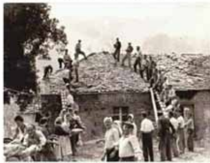
Οι κάτοικοι ενός χωριού της Ηπείρου βοηθούν στην κατασκευή

Κάποτε όταν έφτιαχνε σπίτι κάποιος.....όλο το χωριό βοηθούσε. Τώρα όταν φτιάχνει σπίτι κάποιος.....το μισό χωριό καλεί την πολεοδομία και το άλλο μισό την αστυνομία.....Γιατί ;