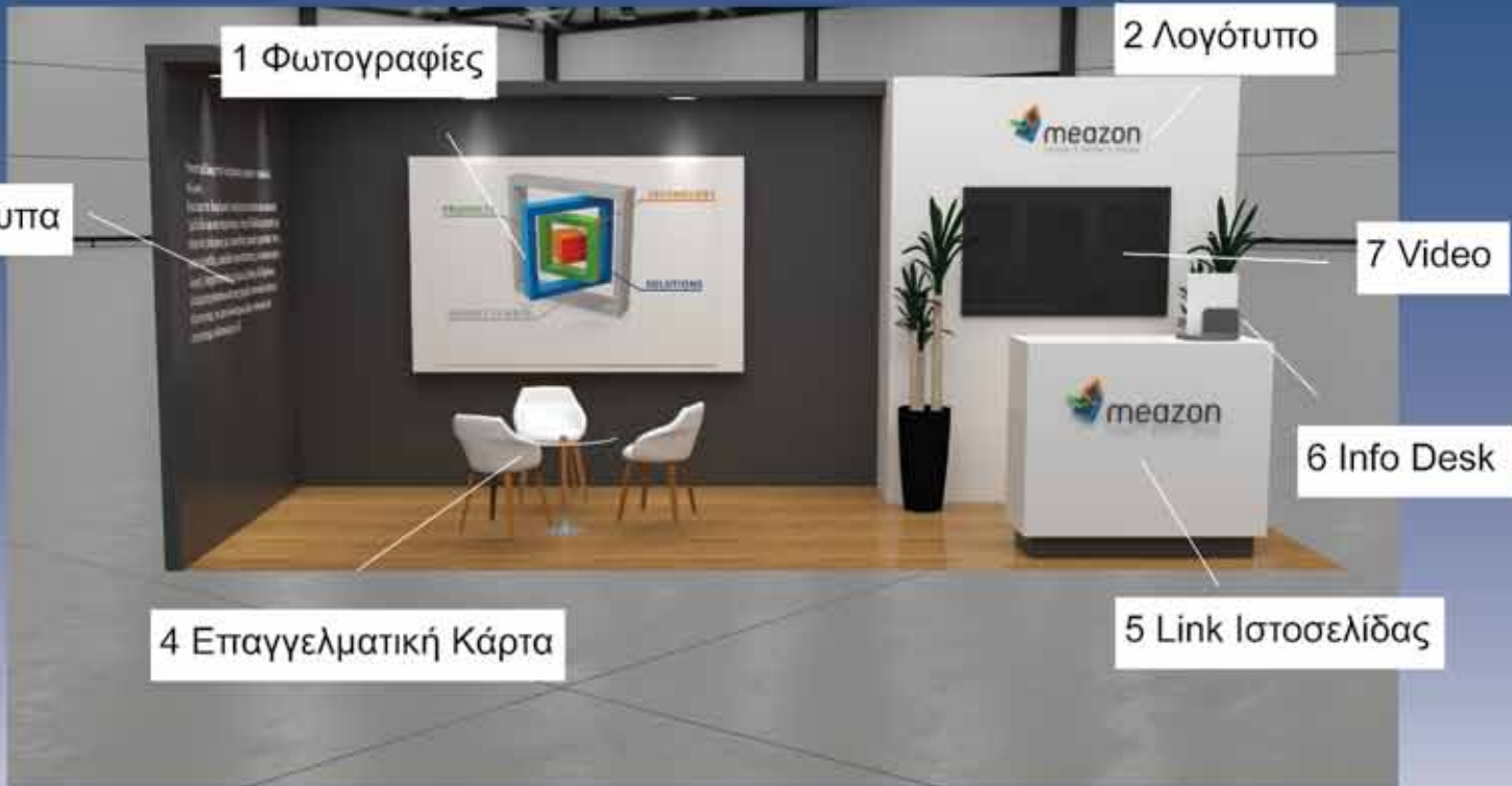
Δείγμα εικονικού περιπτέρου με τις προτεινόμενες επιλογές σημάνσεων (hot spot)