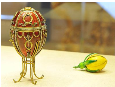
«Το αυγό με το τριαντάφυλλο μπουμπούκι»

Μετά το θάνατο του τσάρου Αλέξανδρου Γ' το 1894, ο γιος και διάδοχός του, Νικόλαος Β', συνέχισε την παράδοση χαρίζοντας κάθε Πάσχα ένα αυγό στη μητέρα του, αλλά και στη σύζυγό του Αλεξάνδρα Φεντόροβνα.