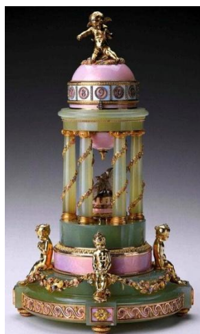
Το αυγό – ρολόι στην αψίδα