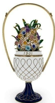
Το αυγό το καλάθι των λουλουδιών

Η βασίλισσα Ελισάβετ είχε επίσης στην κατοχή της τρία αυγά, τα οποία κληρονόμησε από τους γονείς της, «Το καλάθι των λουλουδιών», το «Το αυγό – ρολόι στην αψίδα» και «Το μωσαϊκό αυγό».