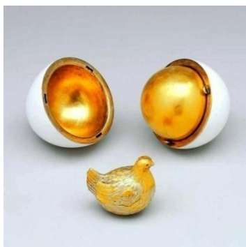
«Το αυγό Κότα»

Η πρόταση του Φαμπερζέ, η οποία ενθουσίασε τον Τσάρο, ήταν η δημιουργία ενός απλού λευκού αυγού από σμάλτο που στο εσωτερικό του θα τοποθετούνταν ένας χρυσός κρόκος, ο οποίος θα άνοιγε για να εμφανίσει μια χρυσή κότα, η οποία με τη σειρά της θα περιείχε ένα διαμαντένιο στέμμα και ένα μικρό μενταγιόν από ρουμπίνι. Τα υλικά ήταν δαπανηρά, αλλά η μαγική έκπληξη ήταν ανεκτίμητη. Το αυγό αυτό έγινε γνωστό ως «η Κότα» (σύμβολο αναγέννησης).