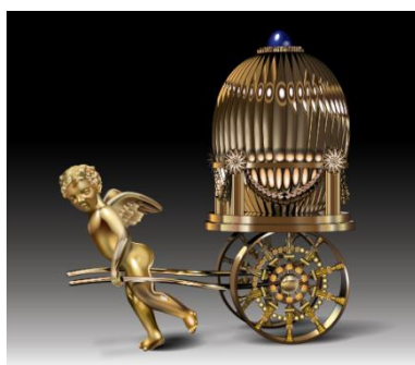
«Το αυγό με τα χερουβείμ και την άμαξα»

Τα δραματικά γεγονότα της επανάστασης του 1917, είχαν ως συνέπεια να κλείσει η εταιρεία Φαμπερζέ το 1918. Ο ίδιος ο Πέτερ Καρλ Φαμπερζέ έφυγε για την Ρήγα και από εκεί πήγε στην Γερμανία, όπου αρρώστησε καθώς τον κυρίευσε η θλίψη που έφυγε από τη πατρίδα του. Ο γιος του Ευγένιος (1874 – 1960) μετέφερε την τέφρα του πατέρα του, καθώς και της μητέρας του Αυγούστας, η οποία έχε πεθάνει το 1925, από τη Λωζάνη και την ενταφίασε στον οικογενειακό τάφο από την πλευρά της μητέρας του, στο Κοιμητήριο Grand Jas στις Κάννες της Γαλλίας.