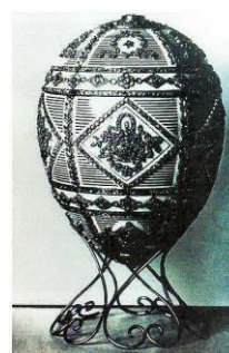
Το αυγό στη μνήμη του Αλέξανδρου του Γ'

Σήμερα τα δύο πρώτα αυγά, «η Κότα» και «Το Αυγό με το τριαντάφυλλο μπουμπούκι» βρίσκονται στο ιδιωτικό Μουσείο Φαμπερζέ στην Αγία Πετρούπολη. Τα αυγά αυτά όπως και άλλα επτά αυτοκρατορικά αυγά, όπως και περίπου 250 άλλα κοσμήματα Φαμπερζέ, πουλήθηκαν σε δημοπρασία του Οίκου Sotheby's από τους κληρονόμους του Μάλκολμ Φορμπς, εκδότη του περιοδικού Forbes. Ολόκληρη τη συλλογή, αγόρασε τότε απρόσμενα ο Ρώσος δισεκατομμυριούχος Βίκτορ Βέκσελμπεργκ. Λέγεται ότι η συλλογή αυτή του Φορμπς πουλήθηκε έναντι 350 εκατομμυρίων δολαρίων!!!