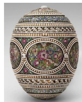
Το μωσαϊκό αυγό