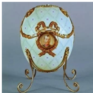
«Το αυγό το Τάγμα του Αγίου Γεωργίου»

Στη συλλογή του Βέκσελμπεργκ, η οποία βρίσκεται στο μουσείο Φαμπερζέ στην Αγία Πετρούπολη, υπάρχει ένα ξεχωριστό πασχαλινό αυγό, «Το Τάγμα του Αγίου Γεωργίου». Το εν λόγω αυγό, που κατασκευάστηκε την άνοιξη του 1916, το είχε παραγγείλει ο τσάρος Νικόλαος Β' για να το κάνει δώρο στη μητέρα του (ήταν και το τελευταίο αυγό που πρόλαβε να της κάνει). Μετά το θάνατο της το 1928, το πήρε η μεγαλύτερη κόρη της, η Ξένια και στη συνέχεια, στη δεκαετία του '60 ο γιος της Βασίλειος. Στη συνέχεια το αγόρασαν αντιπρόσωποι της εταιρείας Φαμπερζέ. Το 1978 το αυγό «Το Τάγμα του Αγίου Γεωργίου» κατέληξε στην συλλογή των «Φορμπς». Σχεδόν 100 χρόνια αργότερα, επέστρεψε στη Ρωσία.