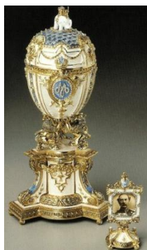
Το αυγό η επέτειος της Δανίας