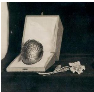
Το αυγό Νεσεσέρ

Η επαναστατική κυβέρνηση των μπολσεβίκων, άρχισε να πουλάει πολλά από τα κομψοτεχνήματα του, πολύ φθηνά, σχεδόν τζάμπα, στα καταστήματα της Αγίας Πετρούπολης ενώ στη συνέχεια τα πουλούσε στο εξωτερικό μέσω της εταιρείας «Αντίκες» (Σοβιετικός οργανισμός εξωτερικού εμπορίου). Τα περισσότερα από τα κοσμήματα κατέληξαν στην Ευρώπη και τις Ηνωμένες Πολιτείες, κυρίως σε ιδιωτικές συλλογές. Ακριβή στοιχεία για τον αριθμό των κοσμημάτων που πουλήθηκαν μετεπανάστατικά στο εξωτερικό αλλά και για τους αγοραστές τους δεν υπάρχουν, καθώς τα μοναδικά αυτά κοσμήματα πουλήθηκαν κυριολεκτικά «με το ζύγι». Μέχρι σήμερα για παράδειγμα, είναι άγνωστο που βρίσκεται «Η Κότα με το ζαφειρένιο μενταγιόν», που ήταν η δεύτερη δημιουργία από την σειρά των αυτοκρατορικών Πασχαλινών Αυγών (σύμφωνα με την περιγραφή που υπάρχει στα Κρατικά Αρχεία της Σοβιετικής Ένωσης, το κόσμημα αυτό ήταν «μια κότα από χρυσό και μπριγιάν, που έβγαζε από ένα καλάθι ένα ζαφειρένιο αυγό»). Επίσης έχουν χαθεί ή κλαπεί τα αυτοκρατορικά Πασχαλινά αυγά με τις ονομασίες «Τα χερουβείμ και η άμαξα» «Το Νεσεσέρ», «Η επέτειος της Δανίας» και «Στη μνήμη του Αλέξανδρου του Γ'».