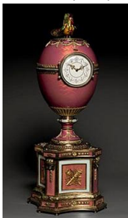
Το αυγό-ρολόι Ρότσιλντ