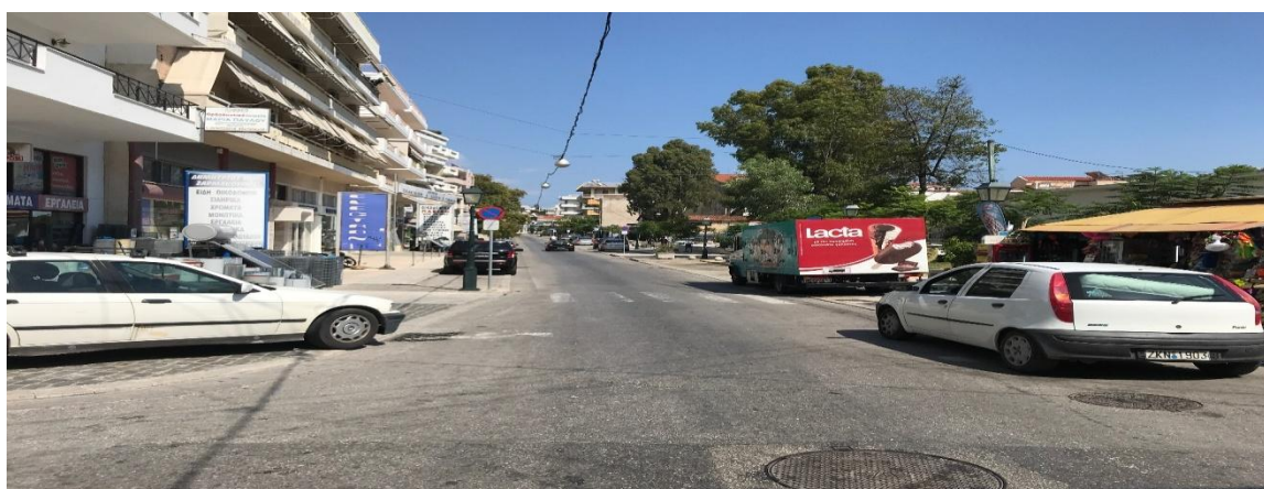
Φωτογραφία 15: Άποψη της οδού Ιντζέ (Διάγραμμα Γ, Θέση 15)