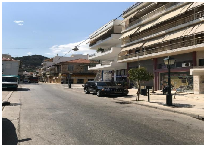
Φωτογραφία 16: Άποψη της οδού Ιντζέ (Διάγραμμα Γ, Θέση 16)

Από τις φωτογραφίες 15 ως 16 που παρουσιάζουν την εικόνα της οδού Ιντζέ, γίνεται αντιληπτό πως δεν υπάρχει ενιαία φιλοσοφία στη διαμόρφωση των προσόψεων των καταστημάτων τόσο σε επίπεδο χρωματισμών και υλικών, όσο και σε επιλογή στεγάστρου και επιγραφών. Ενδεικτικά αναφέρονται χρωματισμοί στους τόνους, του λευκού, του γκρι, του κίτρινου, του μπλε ακόμα και του ροζ, ενώ σχετικά με τις