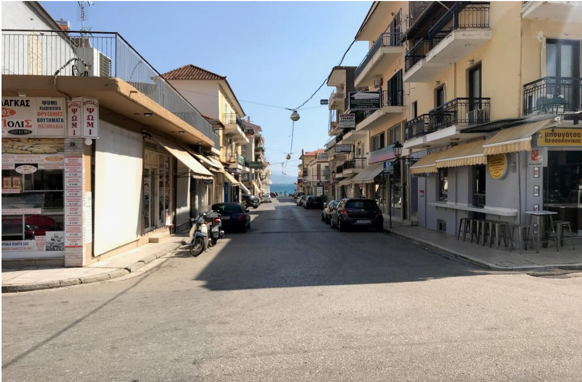
Φωτογραφία 11: Άποψη της οδού Δημητρίου Ψαρρού από το ύψος της Τζαβέλλα (Διάγραμμα Γ, Θέση 11)

Από τη φωτογραφία 11 που απεικονίζει τις προσόψεις των καταστημάτων γίνεται αντιληπτό πως δε υπάρχει κοινή κατεύθυνση στο σχεδιασμό και διαμόρφωση των προσόψεων των καταστημάτων. Όσον αφορά τους χρωματισμούς εντοπίζονται αποχρώσεις του κίτρινου, του γκρι, του μωβ και του μπεζ, ενώ ποικιλία υπάρχει και στα υλικά επένδυσης των εξωτερικών επιφανειών με κάποια καταστήματα να διαθέτουν πλακάκια σε κεραμιδί αποχρώσεις και κάποια απλό χρωματισμό (επίχρισμα). Διαφοροποιήσεις υπάρχουν και στην επιλογή ή όχι στεγάστρων, με ορισμένα καταστήματα να διαθέτουν τέντες διαφορετικού μεγέθους και σχήματος, ενώ σημαντικές διαφορές υπάρχουν και στη γραμματοσειρά και τον τρόπο τοποθέτησης των επιγραφών των καταστημάτων.