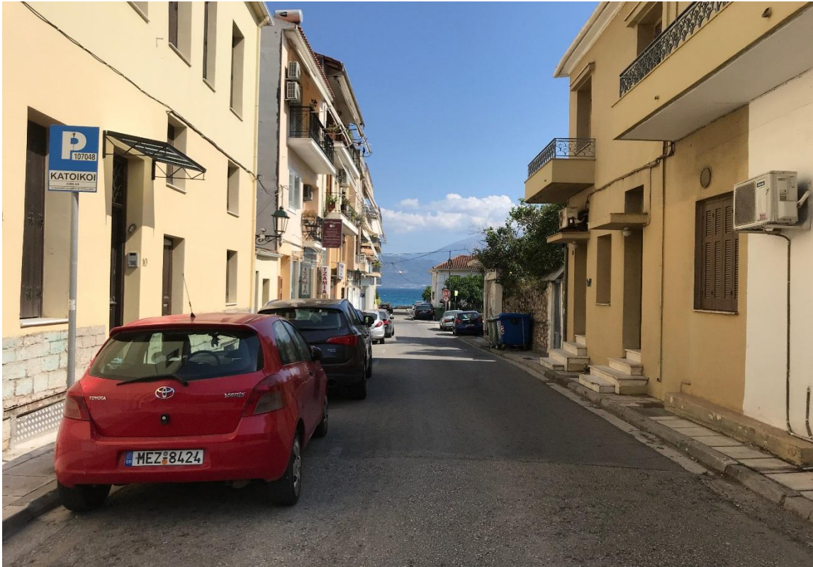
Φωτογραφία 9: Άποψη της οδού Πλαστήρα (Διάγραμμα Β, Θέση 9)

Με τη συγχρηματοδότηση της Ελλάδας και της Ευρωπαϊκής Ένωσης