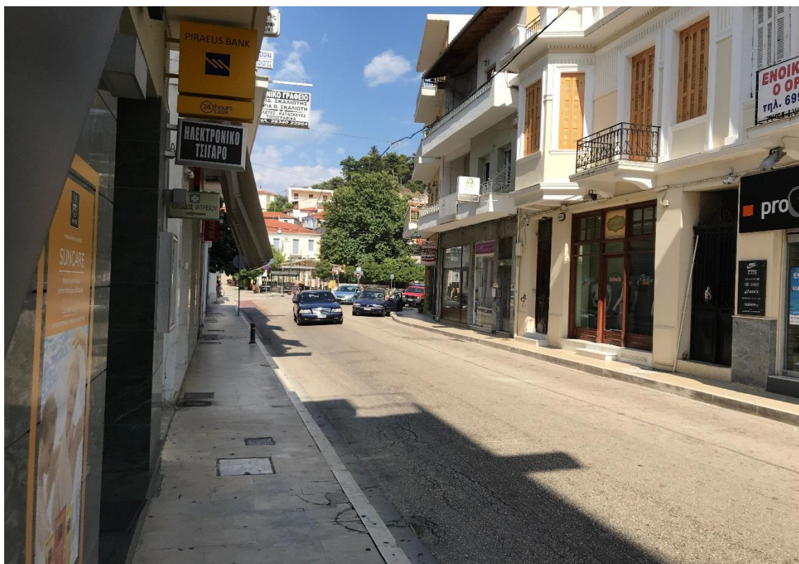
Φωτογραφία 1: Προσόψεις καταστημάτων και δημόσιος χώρος στην οδό Τζαβέλλα (Διάγραμμα Γ, Θέση 1)