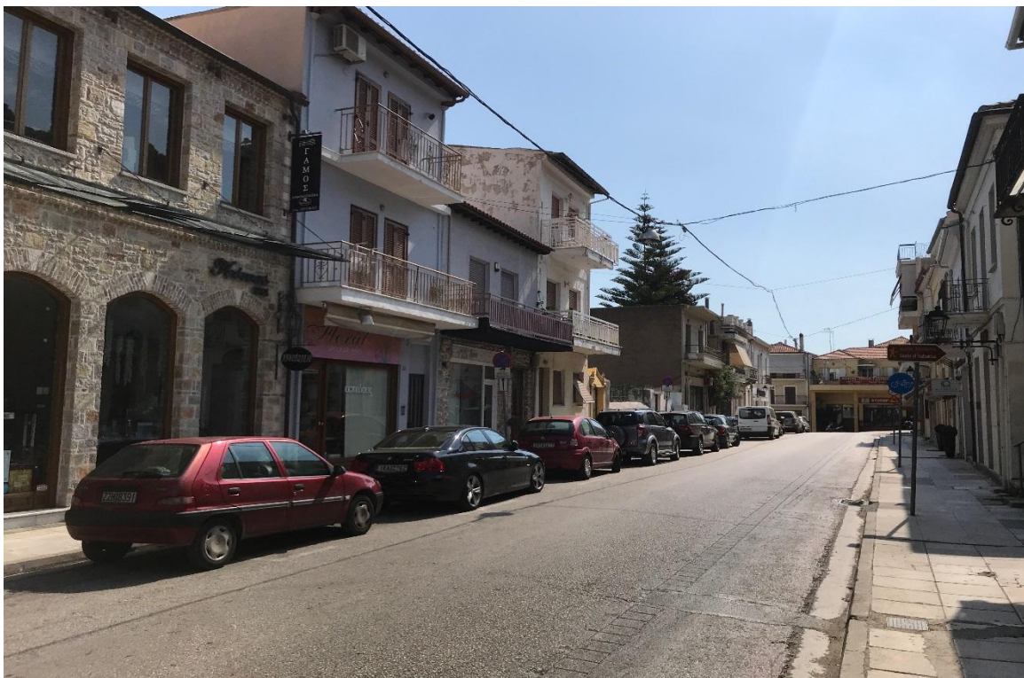
Φωτογραφία 3: Προσόψεις καταστημάτων στην οδό Τζαβέλλα, (Διάγραμμα Α, Θέση 3)

Από τις φωτογραφίες 1, 2 και 3 που απεικονίζουν τυπικές επιχειρήσεις της οδού Τζαβέλλα, γίνεται αντιληπτό ότι δεν εντοπίζεται κάποιου είδους τυποποίηση, όσον αφορά τη διαμόρφωση των προσόψεων.