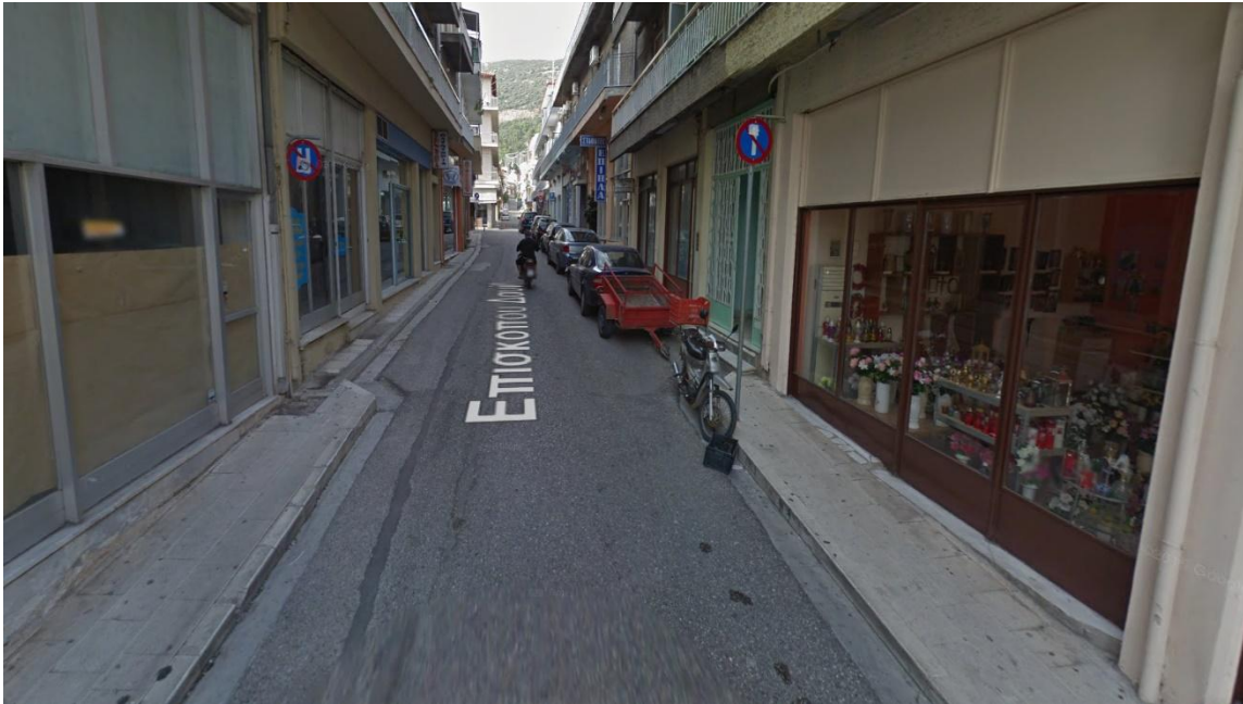
Φωτογραφία 10: Άποψη της οδού Επισκόπου Δαβίδ από το μέσο του οδικού τμήματος (Διάγραμμα Γ, Θέση 10)

Με τη συγχρηματοδότηση της Ελλάδας και της Ευρωπαϊκής Ένωσης