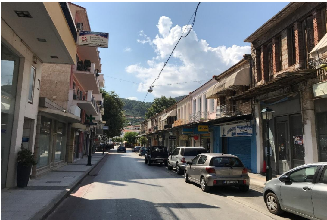
Φωτογραφία 14: Προσόψεις καταστημάτων στην οδό Αθηνών (Διάγραμμα Δ, Θέση 14)

Από τις φωτογραφίες 12, 13 και 14 που απεικονίζουν τυπικές επιχειρήσεις της οδού Αθηνών, γίνεται αντιληπτό ότι δεν υπάρχει κοινή φιλοσοφία, όσον αφορά τη διαμόρφωση των προσόψεων. Οι χρωματισμοί ποικίλουν (ανοιχτό γκρι, κίτρινο, λευκό, καφέ, μπλε, σκούρο γκρι, ροζ) γεγονός το οποίο