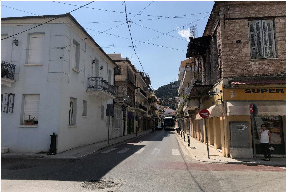
Φωτογραφία 20: Άποψη της οδού Αρβανίτη (Διάγραμμα Δ, Θέση 20)

Πρόκειται για το οδικό τμήμα μήκους 70μ που οριοθετείται από την οδό Αθηνών και από την Θ. Νόβα. Στο συγκεκριμένο τμήμα υπάρχουν συνολικά 2 καταστήματα παροχής υπηρεσιών (στεγνοκαθαριστήριο και κομμωτήριο).