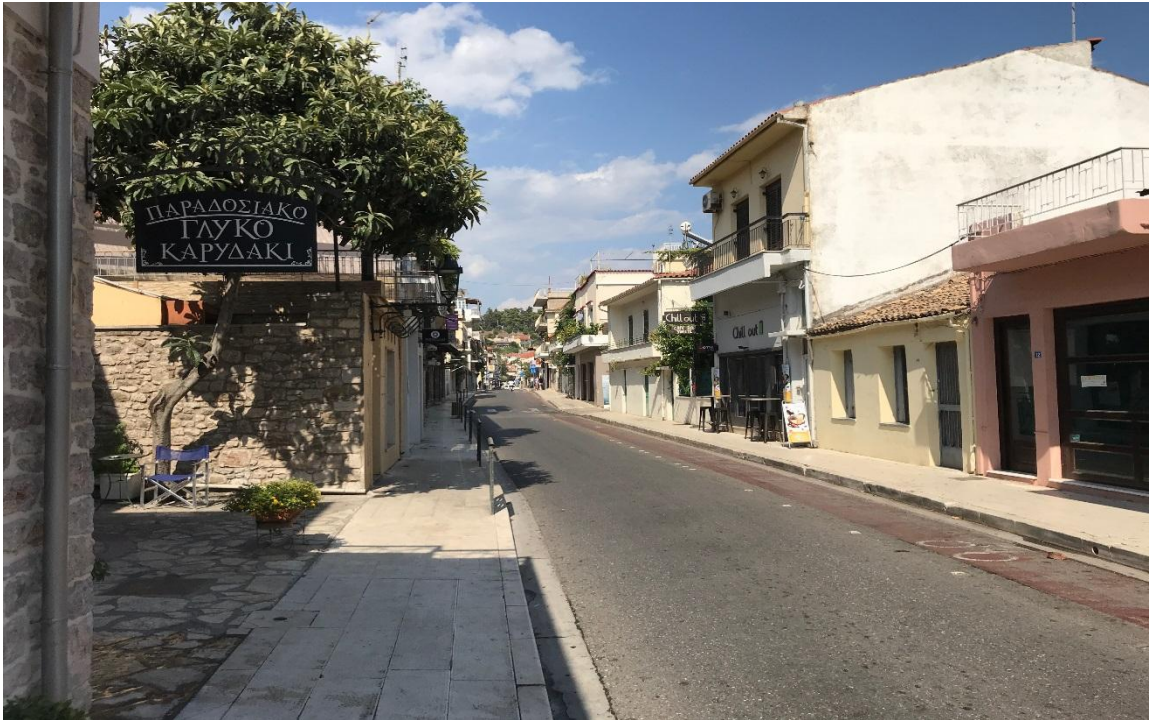
Φωτογραφία 4: Αποψη της οδού Ν. Μπότσαρη (Διάγραμμα Α, Θέση 4)

Με τη συγχρηματοδότηση της Ελλάδας και της Ευρωπαϊκής Ένωσης