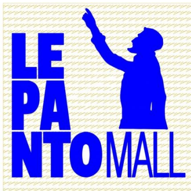
Εικόνα 3 Λογότυπο προγράμματος

Η ξύλινη επιγραφή θα είναι από κόντρα πλακέ θαλάσσης πάχους 10χιλ. με ανάγλυφα γράμματα και σχήμα από διάφανο plexiglass, με αυτοκόλλητο στην πίσω όψη με βαφή σε χρώμα καστανιάς συνολικής διάστασης 20εκ *20εκ ή 30εκ*30εκ. Στον προσωρινά κηρυγμένο αρχαιολογικό χώρο /ιστορικό τόπο θα τοποθετηθεί η επιγραφή με διαστάσεις 20εκ*20εκ, σύμφωνα με τις επισημάνσεις της Εφορείας Αρχαιοτήτων Αιτω/νίας & Λευκάδας. Εκτός αυτού του χώρου θα τοποθετηθεί η επιγραφή διαστάσεων 30εκ*30εκ. Το αυτοκόλλητο στην πίσω όψη θα είναι το λογότυπο του προγράμματος Ανοικτό Κέντρο Εμπορίου Δήμου Ναυπακτίας. βλ. σχέδιο