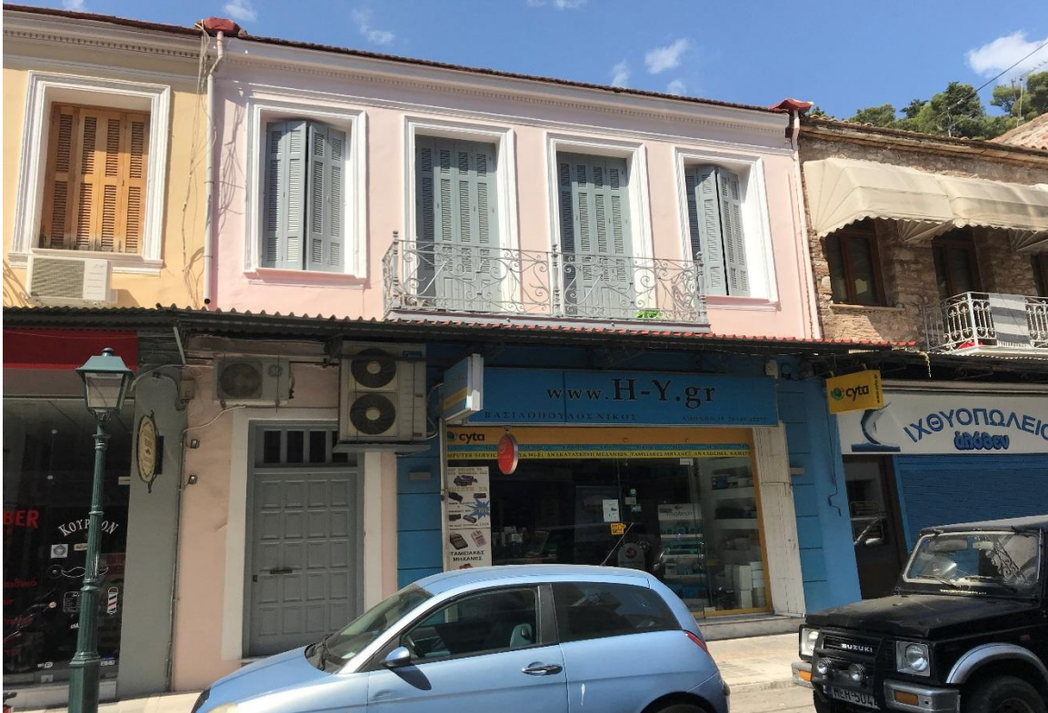
Φωτογραφία 23: Η πρόσοψη της 2 ης Τυπικής Επιχείρησης της περιοχής παρέμβασης (οδός Αθηνών)

Στην ισόγεια ζώνη διατάσσεται μια μεγάλη ενιαία βιτρίνα και η είσοδος προς την κατοικία του ορόφου. Το κατάστημα καταλαμβάνει τα 6,00μ. περίπου από τα 8,00μ. της πρόσοψης.