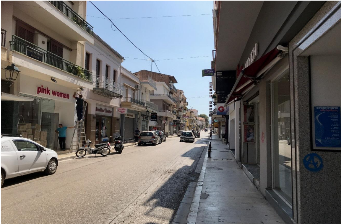
Φωτογραφία 2: Προσόψεις καταστημάτων στην οδό Τζαβέλλα (Διάγραμμα Γ, Θέση 2)

Με τη συγχρηματοδότηση της Ελλάδας και της Ευρωπαϊκής Ένωσης