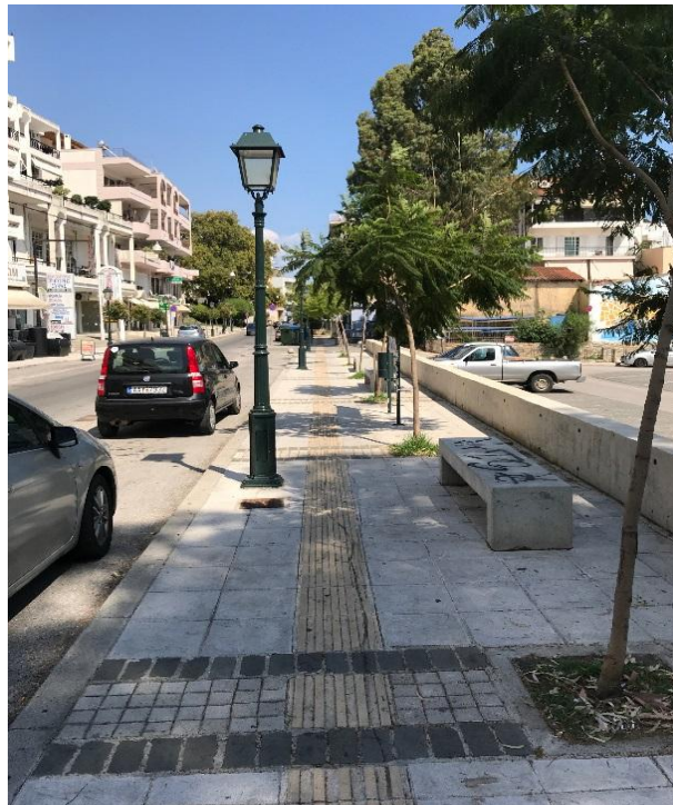
Φωτογραφία 17: Άποψη (Διάγραμμα Δ, Θέση 17)