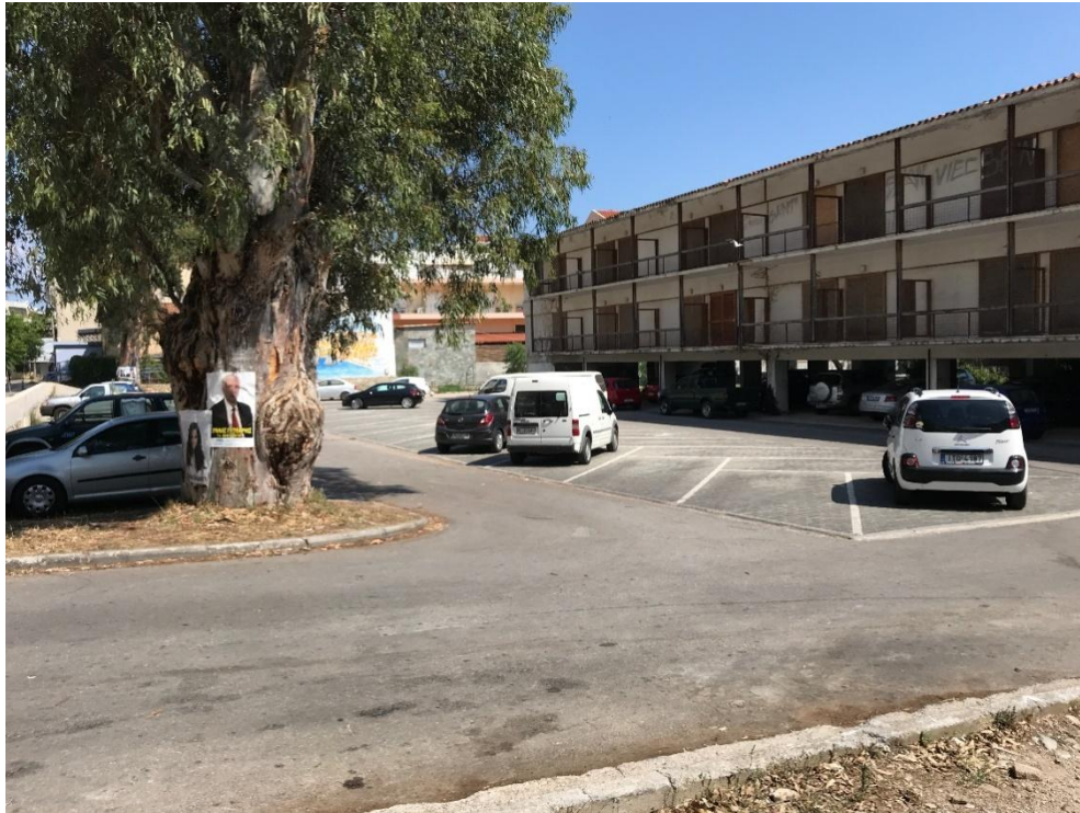
Φωτογραφία 18: Ο υπαίθριος χώρος στάθμευσης στην οδό Θ. Νόβα μπροστά από το ξενοδοχείο Ξενία (διάγραμμα Δ, θέση 18)

Με τη συγχρηματοδότηση της Ελλάδας και της Ευρωπαϊκής Ένωσης