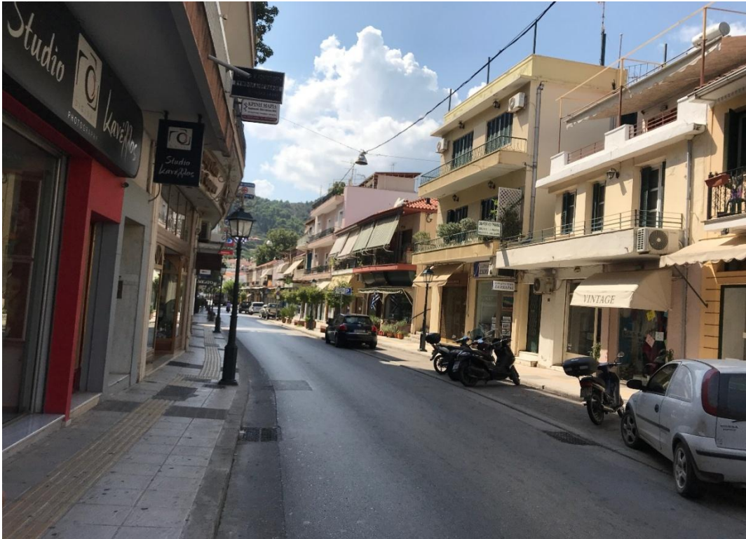
Φωτογραφία 13: Προσόψεις καταστημάτων στην οδό Αθηνών (Διάγραμμα Δ, Θέση 13)

Με τη συγχρηματοδότηση της Ελλάδας και της Ευρωπαϊκής Ένωσης