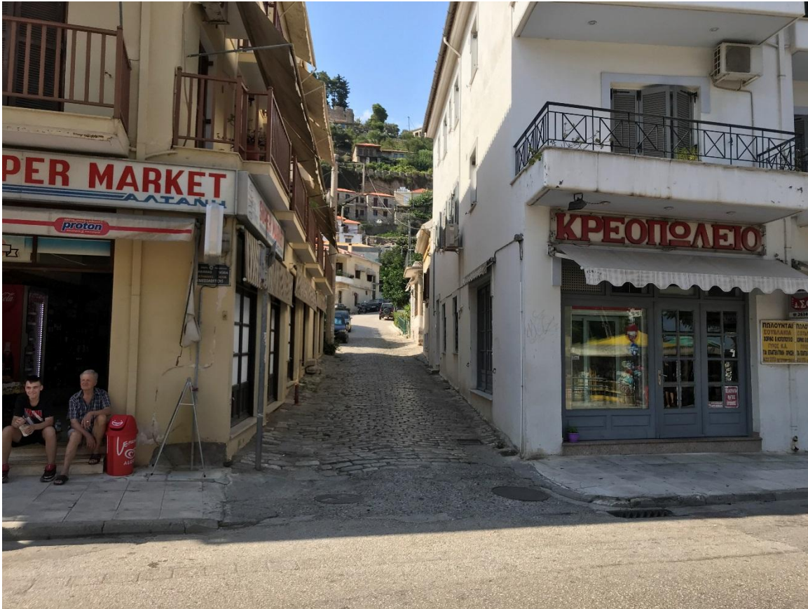
Φωτογραφία 24: Η πρόσοψη της 3 ης Τυπικής Επιχείρησης της περιοχής παρέμβασης

Με τη συγχρηματοδότηση της Ελλάδας και της Ευρωπαϊκής Ένωσης