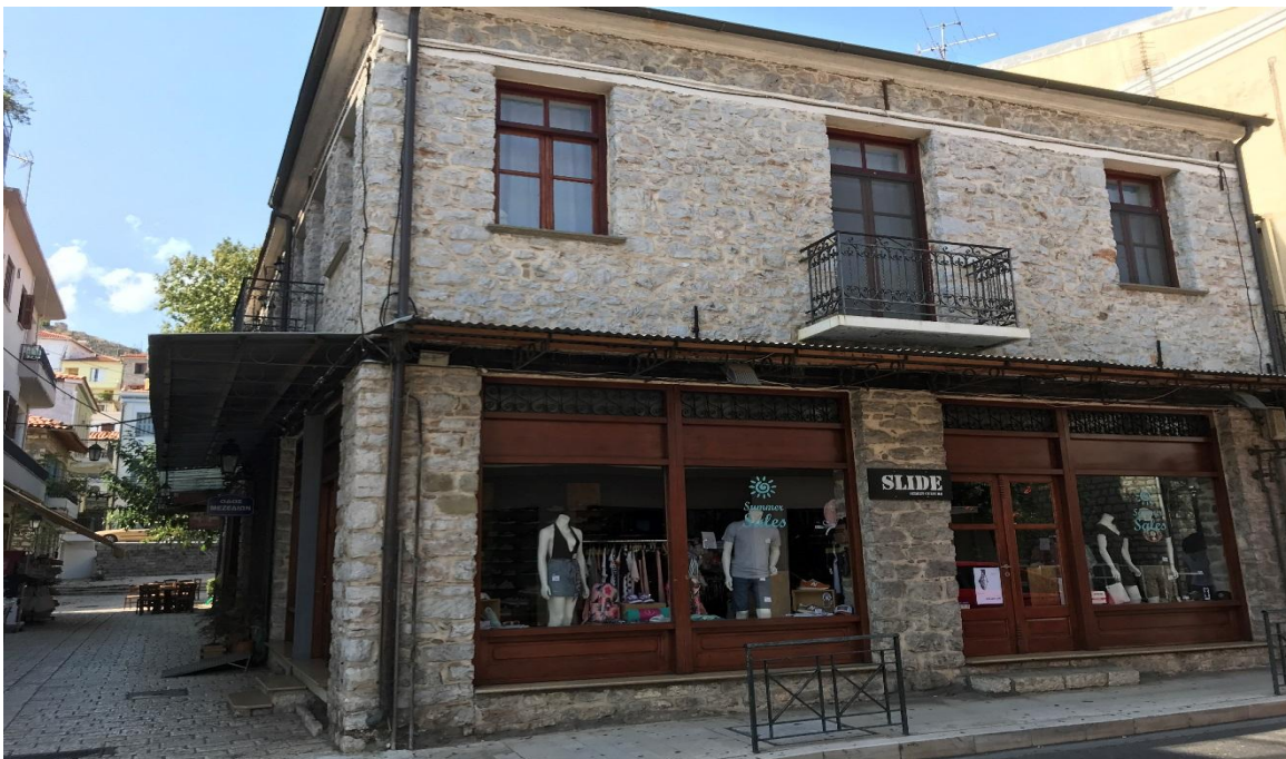
Φωτογραφία 22: Η πρόσοψη της 1 ης Τυπικής Επιχείρησης της περιοχής παρέμβασης (οδός Νότη Μπότσαρη)

Η βιτρίνα διατάσσεται σε δύο μεγάλα τμήματα και έχει ξύλινα κουφώματα.