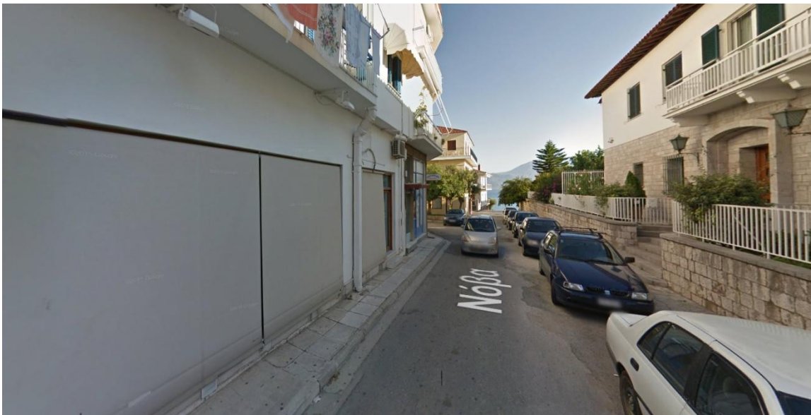
Φωτογραφία 8: Άποψη της οδού Νόβα (Διάγραμμα Β, Θέση 8)

Πρόκειται για το μικρό οδικό τμήμα μήκους 65μ που βρίσκεται μεταξύ των οδών Τζαβέλλα και Μπότσαρη. Εντοπίζεται η ύπαρξη μόνο ενός καταστήματος που εμπορεύεται σιδηρικά – χρώματα – είδη οικοδομής.