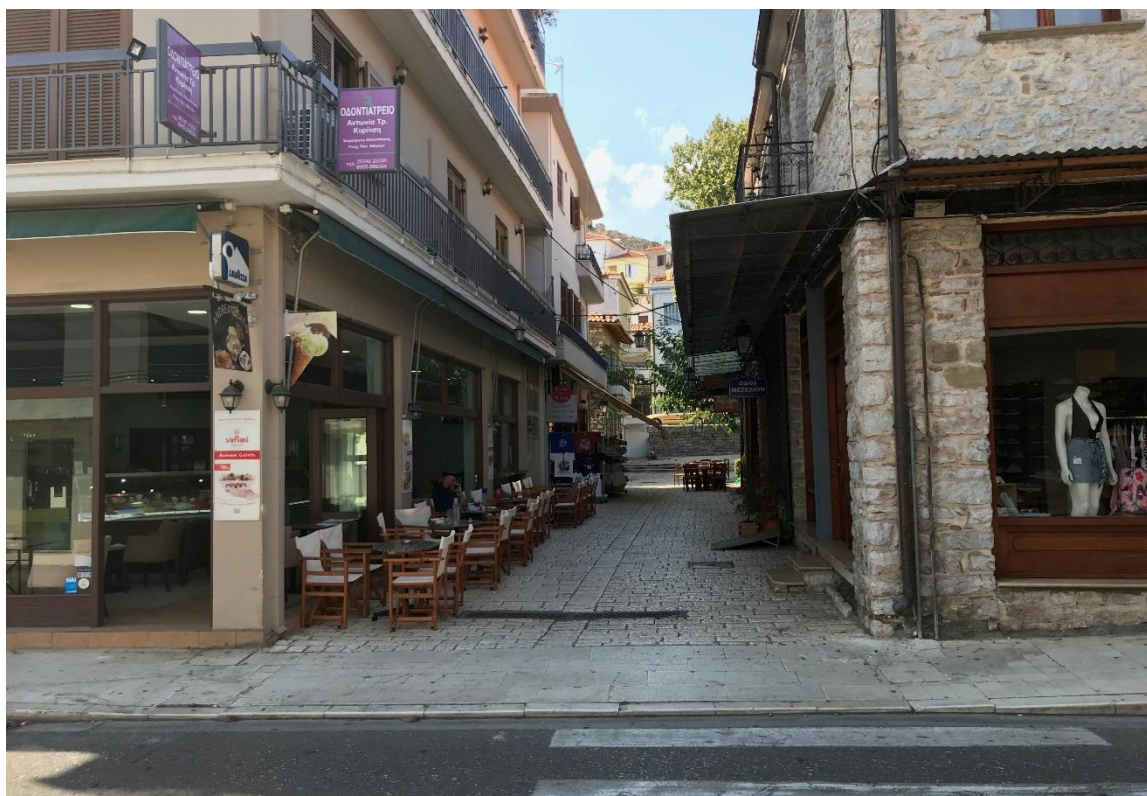
Φωτογραφία 6: Άποψη της οδού Σισμάνη (Διάγραμμα Α, Θέση 6)

Το συγκεκριμένο οδικό τμήμα χωροθετείται μεταξύ των οδών Τζαβέλλα και Νότη Μπότσαρη και έχει μήκος 65 μέτρα. Σύμφωνα με τον πίνακα 4 στο τμήμα αυτό εντοπίζονται συνολικά 3 καταστήματα τα οποία δραστηριοποιούνται στο χώρο του λιανικού εμπορίου. Συγκεκριμένα πρόκειται για καταστήματα που εμπορεύονται πίνακες, ρούχα και αξεσουάρ.