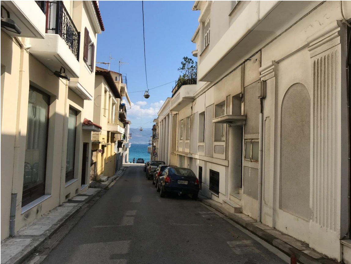
Φωτογραφία 7: Άποψη του της οδού Αγελαού (Διάγραμμα Β, Θέση 7)

Πρόκειται για το μικρού μήκους οδικό τμήμα μήκους 65μ που οριοθετείται από τις οδούς Τζαβέλλα και Μπότσαρη. Στο συγκεκριμένο τμήμα δεν εντοπίζεται εμπορική δραστηριότητα.