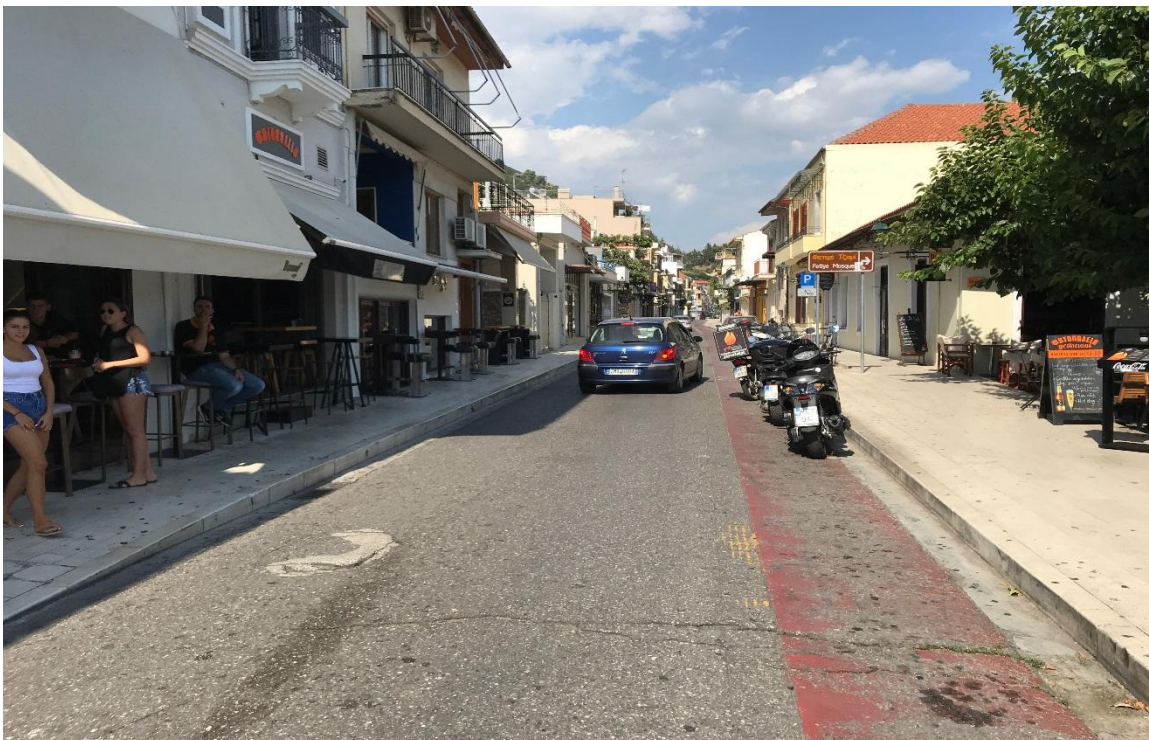
Φωτογραφία 5: Προσόψεις καταστημάτων στην οδό Ν. Μπότσαρη (Διάγραμμα Α, Θέση 5)

Από τις φωτογραφίες 5 ως 7 που παρουσιάζουν την εικόνα της οδού Μπότσαρη, γίνεται αντιληπτό πως δεν υπάρχει κοινή αντιμετώπιση όσον αφορά τη φιλοσοφία διαμόρφωσης των προσόψεων των