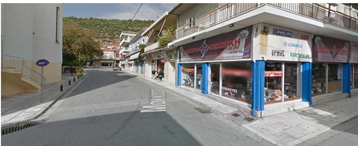
Φωτογραφία 19: Άποψη της οδού Μακκάση (Διάγραμμα Γ, Θέση 19)

Πρόκειται για το οδικό τμήμα μεταξύ της Αθηνών και της Ιντζέ και έχει μήκος 70 μέτρα. Είναι ένας δρόμος στον οποίο εντοπίζεται μόνο 1 κατάστημα παροχής υπηρεσιών (ηλεκτρομηχανολογικές εγκαταστάσεις).