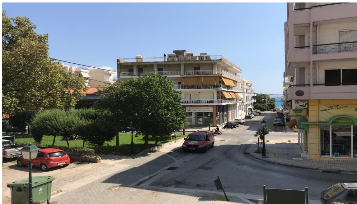
Φωτογραφία 21: Άποψη της οδού Κορυδαλλέως (Διάγραμμα Ε, Θέση 21)

Πρόκειται για το οδικό τμήμα που βρίσκεται μεταξύ των οδών Αθηνών και Καθόδου Δωριέων και έχει μήκος 170μ. Στο τμήμα αυτό που έχει τη λειτουργία τοπικής οδού εντοπίζεται ένα κατάστημα λιανικού εμπορίου επίπλων.