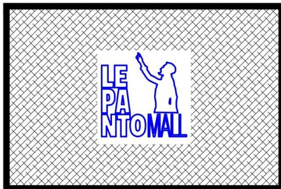
Εικόνα 2 Σκίτσο ποδόμακτρου

Με τη συγχρηματοδότηση της Ελλάδας και της Ευρωπαϊκής Ένωσης