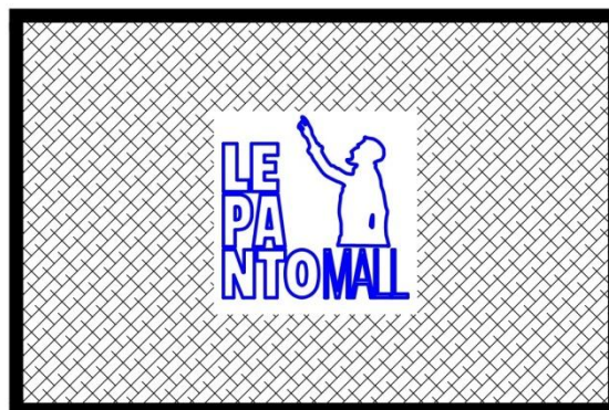
Εικόνα 5 Σκίτσο ποδόμακρου

Στο πατάκι θα αναγράφεται το λογότυπο του προγράμματος Ανοικτού Κέντρου Εμπορίου Ναυπακτίας (στο γαι που θα επιλεγεί) ενώ το πατάκι θα έχει χρώμα μαύρο.