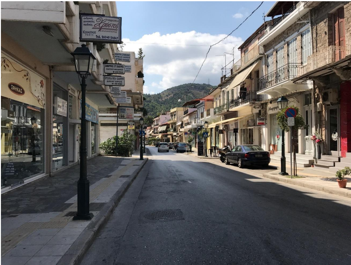
Φωτογραφία 12: Άποψη της οδού Αθηνών (Διάγραμμα Δ, Θέση 12)